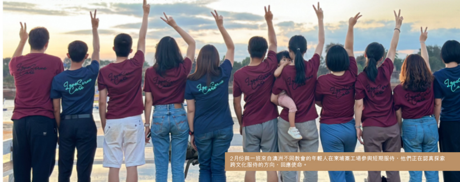
2月份與一班來自澳洲不同教會的年輕人在柬埔寨工場參與短期服侍，他們正在認真探索跨文化服侍的方向，回應使命。